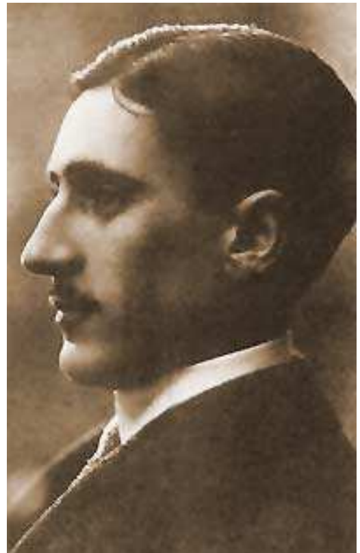
José María Usandizaga